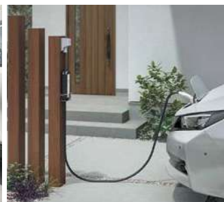
枕木材100角と並べて美しく