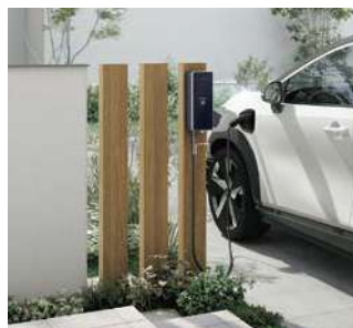
専用ポールと枕木材の組み合わせ

EV充電器は85×150、EVコンセントポールは100角の枕木材を使用。 デザイナーズパーツの枕木材と並べて設置することで、住宅に調和しながら、EVのある暮らしを楽しめます。