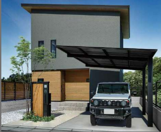
エフルージュ FIRST Z 750タイプ 1台用

カーポート・サイクルポート用の屋根ふき材（ポリカーボネート板）にブラックマット色を追加。モダンでスタイリッシュなブラック色のカーポートが、住宅との更なる調和を生み出します！