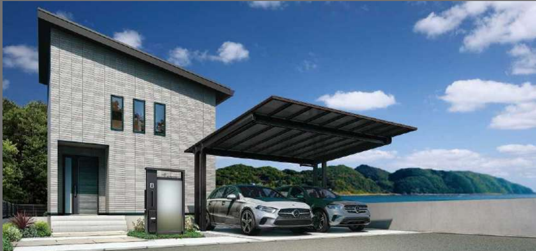
エフルージュ FIRST EX 600タイプ 2台用