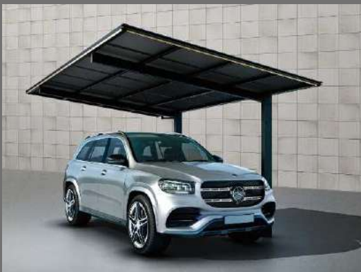
エフルージュ FIRST Z ハイデザイン 750タイプ