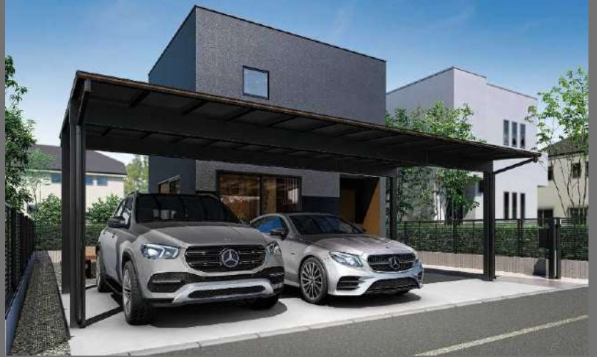
エフルージュ FIRST 600タイプ 3台用